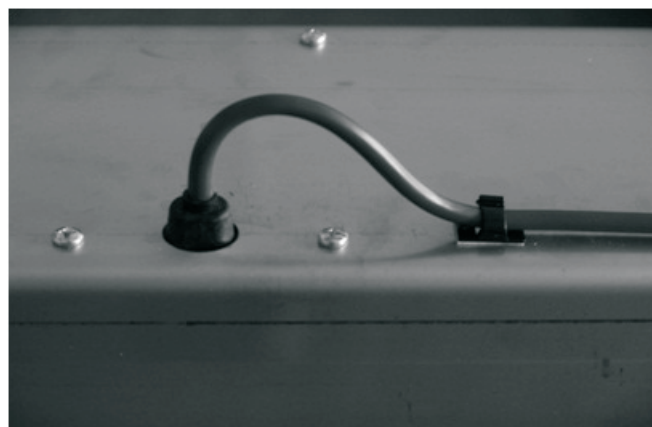
Kabel an der Leuchte darf keinesfalls abgeschnitten werden!